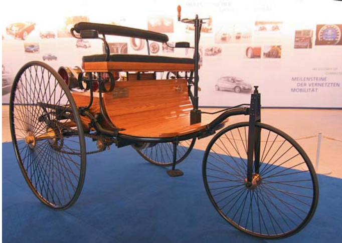
Das erste Automobil vor 125 Jahren

Bei der Fülle an Rückblicken und Vorschauen sind diesmal die aktuellen Meldungen etwas zu kurz gekommen. Und es ist viel passiert. Ecocraft und Think mußten Konkurs anmelden, doch beide wollen weitermachen. Bei Think wird von einem russischen Investor berichtet. Huliez bzw. Mia starten die Produktion, und die Wagen sind zum Anfassen und Er-Fahren vielfach dabei, wie z.B. auf der Challenge Bibendum.