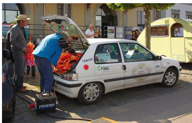
„Kollege“ Jaromir aus Tschechien mit dem mit Akkus vollgepacktem Peugeot 106 mit einer Reichweite > 500 km

aber auch weil's am Pass nicht schneller ging ohne Kopf und Kragen zu riskieren. Was ich beim Aufstieg mehr verbrachte bekomme ich bergab durch die Rekuperation fast voll wieder zurück, nebenbei schont es auch die Bremsbeläge.