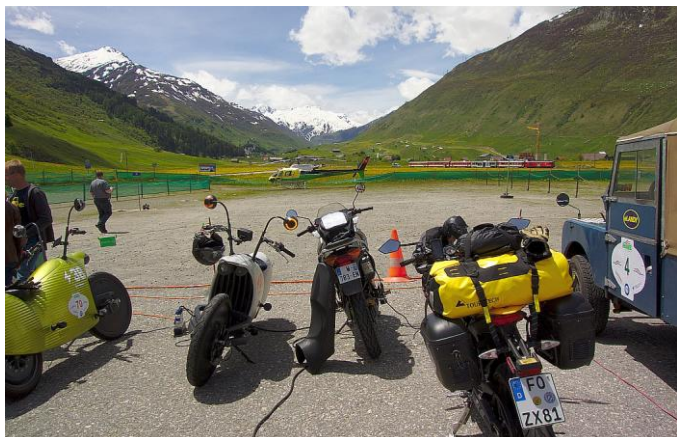
Links erkennt man zwei Johammer aus Österreich

Sogar ein Werkstattwagen war dabei. Weiterhin gab es jeden Tag Prüfungen in verschiedenen Kategorien. Die Zero S konnte die Jury in Reichweite, Komfort und einfaches Laden überzeugen. Für den Reichweitentest hab ich per Smartphone App das Drehmoment auf 15% gedrosselt und fuhr konstant 50 km/h. So kam ich 230 km weit. Trotzdem war ich froh am nächsten Tag wieder „offen“ zu fahren.