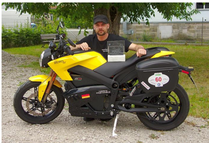
Wieder zuhause mit meiner ZERO S und meiner „WAVE Trophy“ Eigentlich wollte ich nur mitfahren, und dann das: 1. Sieger in der Kategorie der Zweiräder.

Dass Alpenpässe mit dem Motorrad Spaß machen ist ja nichts neues. Aber mit einem E-Bike? Zugegeben, die Zero S fährt sich wie ein Motorrad und macht echt Spaß, das musste auch ein guter Freund zugeben, nachdem er sie gefahren war. Er meinte aber abschließend: „Du wirst halt nie die Alpen damit sehen.“ Der Satz spornte mich an bei der WAVE Trophy mitzufahren, der größten Elektrofahrzeug Rallye der Welt.