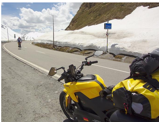
Über den Furkapass

„Dir geht am Pass der Saft aus“ und „Du bekommst eine gewischt wenns regnet“ waren die Sorgen am Motorradstammisch. Nichts von dem ist passiert. Dass die Zero S wasserdicht ist erfuhr ich bereits vorher in der Fränkischen. Aber den Furkapass rauf auf 2400 Metern ist doch was anderes als die paar Hügel um die Ecke.