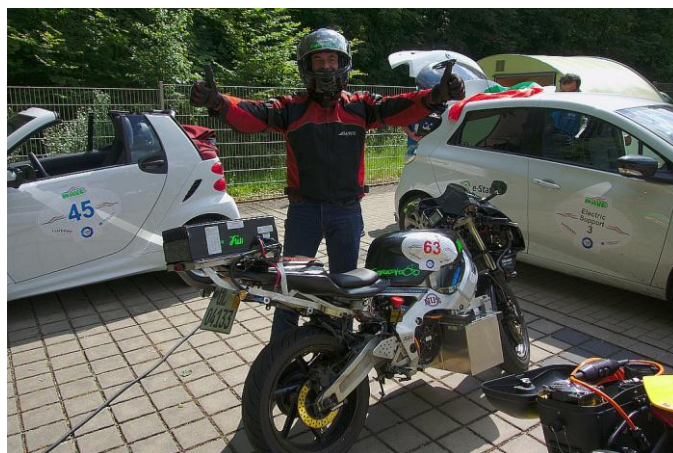
Auch andere Motorräder waren dabei. Rechts ein „electric support car“

Die WAVE Trophy begann am 31. Mai in Stuttgart mit einer Weltrekord Parade fürs Guinness Buch, zu der 500 rein elektrisch angetriebene Fahrzeuge erschienen waren. Danach gings in 8 Tagen über München, den Bodensee über den Furkapass bis in die französischsprachige Schweiz und zurück nach Luzern. Wie bei einer Rallye üblich mussten die Orte zu genauen Zeiten erreicht und verlassen werden, ansonsten gabs Strafpunkte. An den Halten konnten die Fahrzeuge geladen werden, darum hat sich das WAVE Team komplett gekümmert, ebenso war Unterkunft und Verpflegung organisiert.