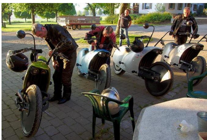
Insgesamt vier Johammer Bikes waren dabei.

Um für die Tagesetappen von 260 km gerüstet zu sein habe ich zwei zusätzliche Lader mit Lüftern in die Koffer fest eingebaut; So konnte ich in 3 statt 9 Stunden voll laden. Zusätzlich fanden auch alle Adapter und die 12 Meter Anschlussleitung Platz. Zwar gibt es vom Hersteller die Option eines Chademo Anschlusses am Motorrad, das ist ein Anschluss für Gleichstrom Schnelllader Säulen. Damit wäre die Zero S in einer Stunde voll. Leider sind diese Lader noch sehr rar bei uns, deswegen hab ich die Buchse nicht verbaut.